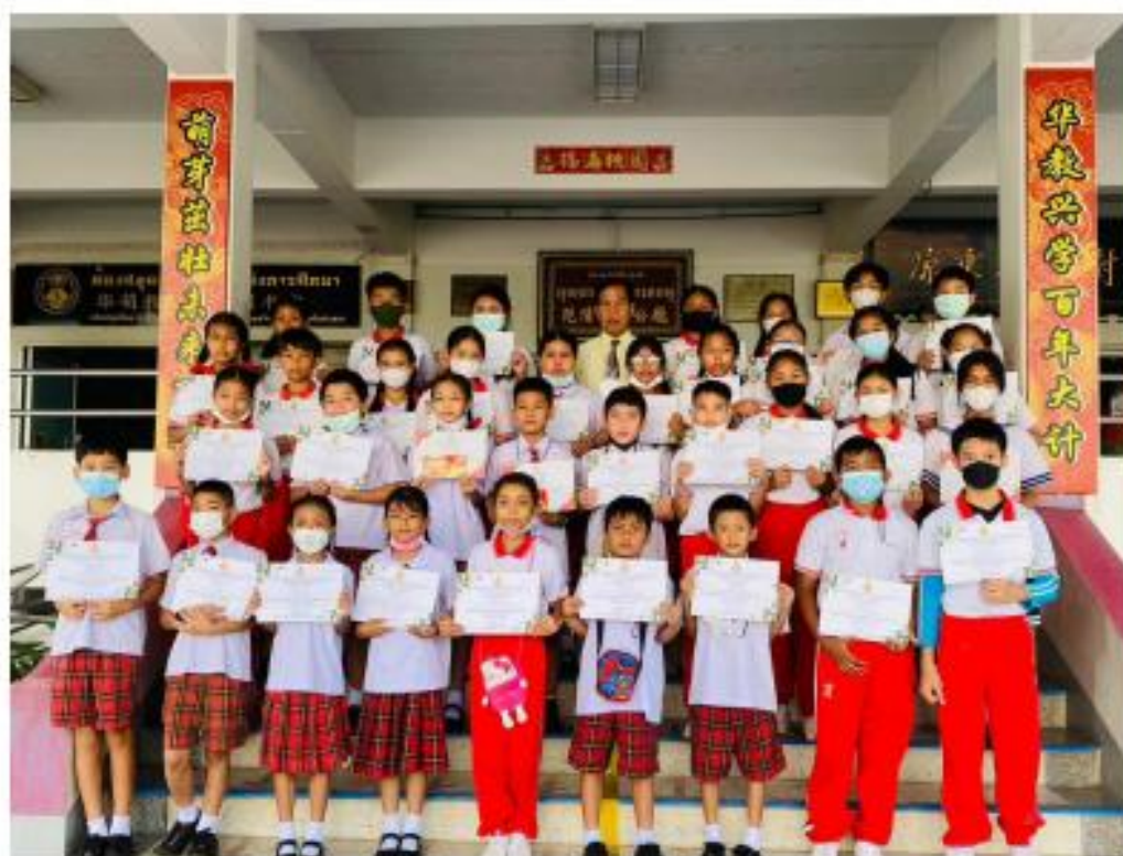
ประมวลภาพการทดสอบ YCT และ HSK วัดความรู้ด้านภาษาจีน นักเรียนระดับประถมศึกษา