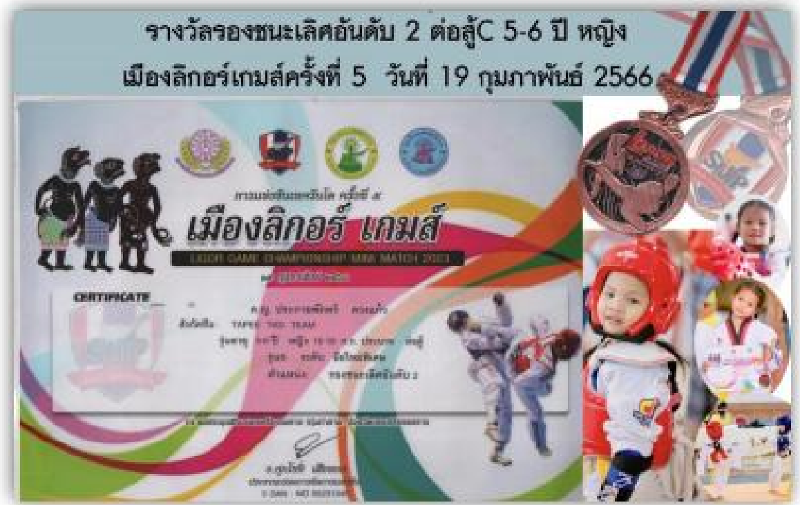
รางวัลรองชนะเลิศอันดับ 2 ด้านกีฬา นักเรียนระดับปฐมวัย