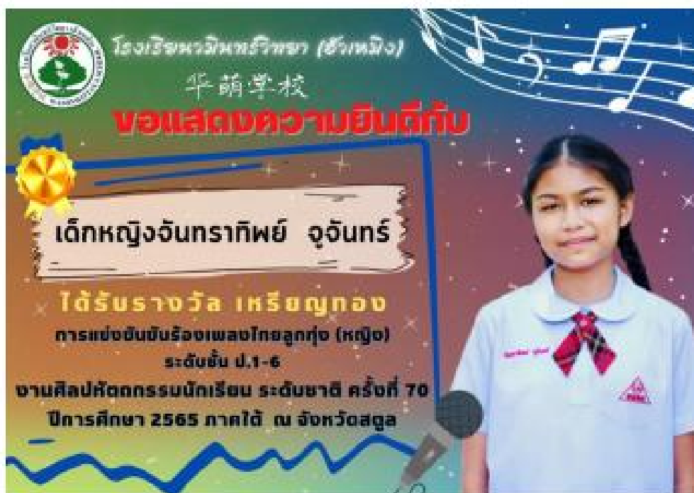
รางวัลเหรียญทอง ด้านดนตรี นักเรียนระดับประถมศึกษา