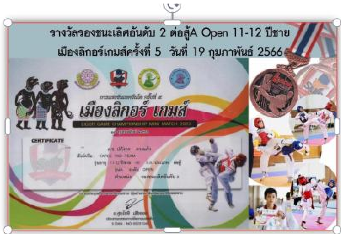
รางวัลรองชนะเลิศอันดับ 2 ด้านกีฬา นักเรียนระดับประถมศึกษา