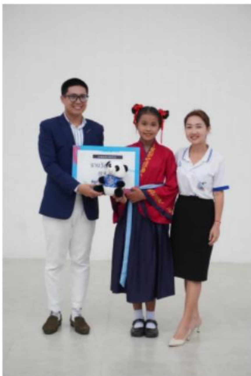
รางวัลเหรียญทอง ด้านดนตรีจีน นักเรียนระดับประถมศึกษา