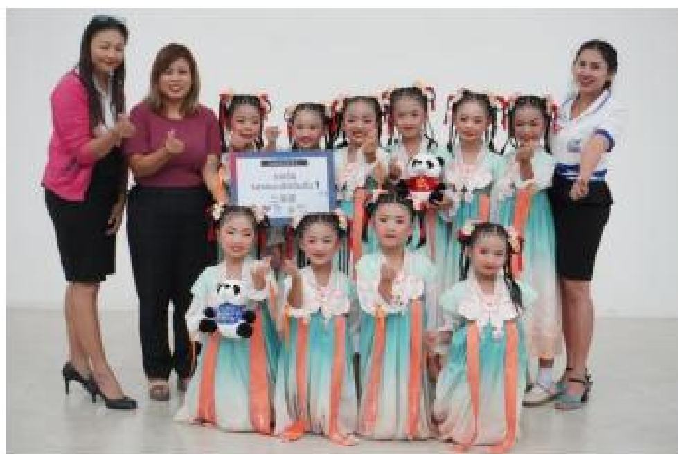
รางวัลเหรียญทอง ด้านดนตรี-นาฏศิลป์จีน นักเรียนระดับประถมศึกษา